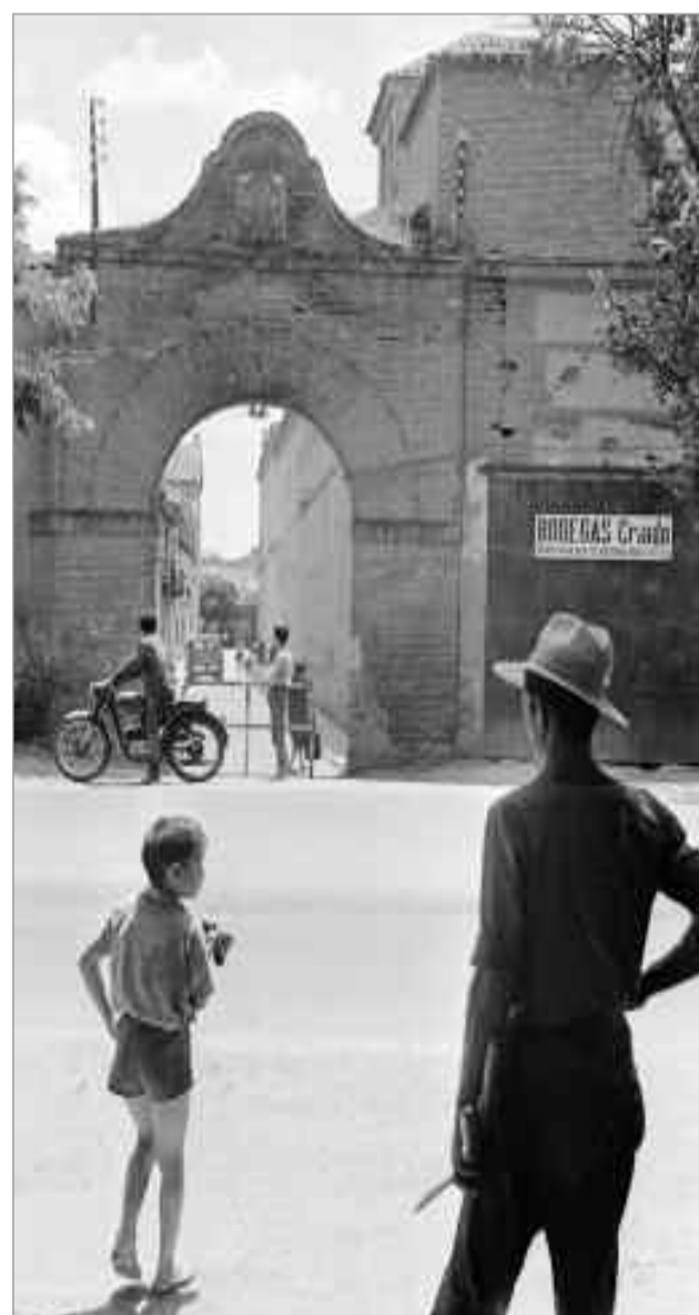
Santos Yubero. 9 diciembre 1941. Alcalá de Henares. Parada militar. Consejo Nacional del SEU. Archivo Regional de la Comunidad de Madrid. Fondo fotográfico Martín Santos Yubero. Sig.038007_037.