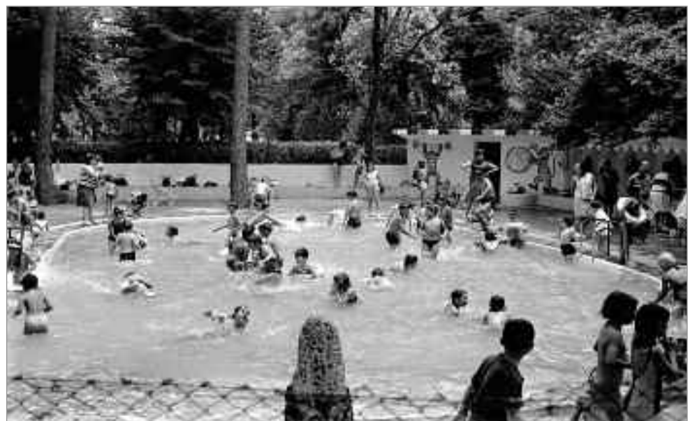
Santos Yubero. 1970-75. Alcalá de Henares. Piscina infantil del parque O'Donnell. Archivo Regional de la Comunidad de Madrid. Fondo fotográfico Martín Santos Yubero. Sig.023404_058.