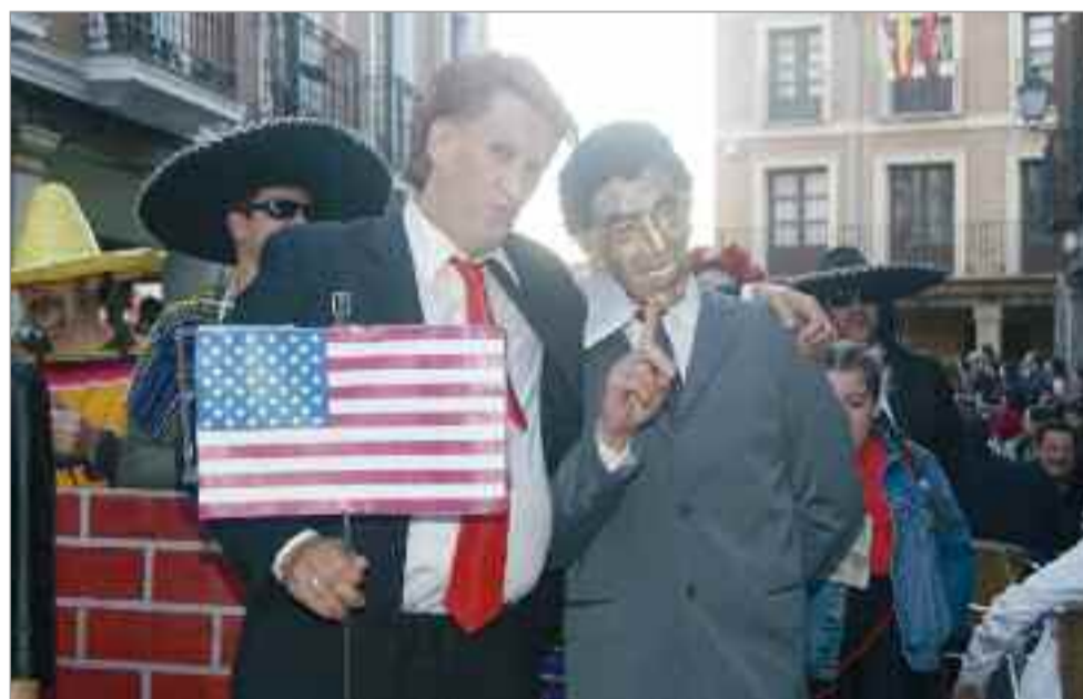
TERCER PREMIO LA HISTORIA EN DIEZ MINUTOS