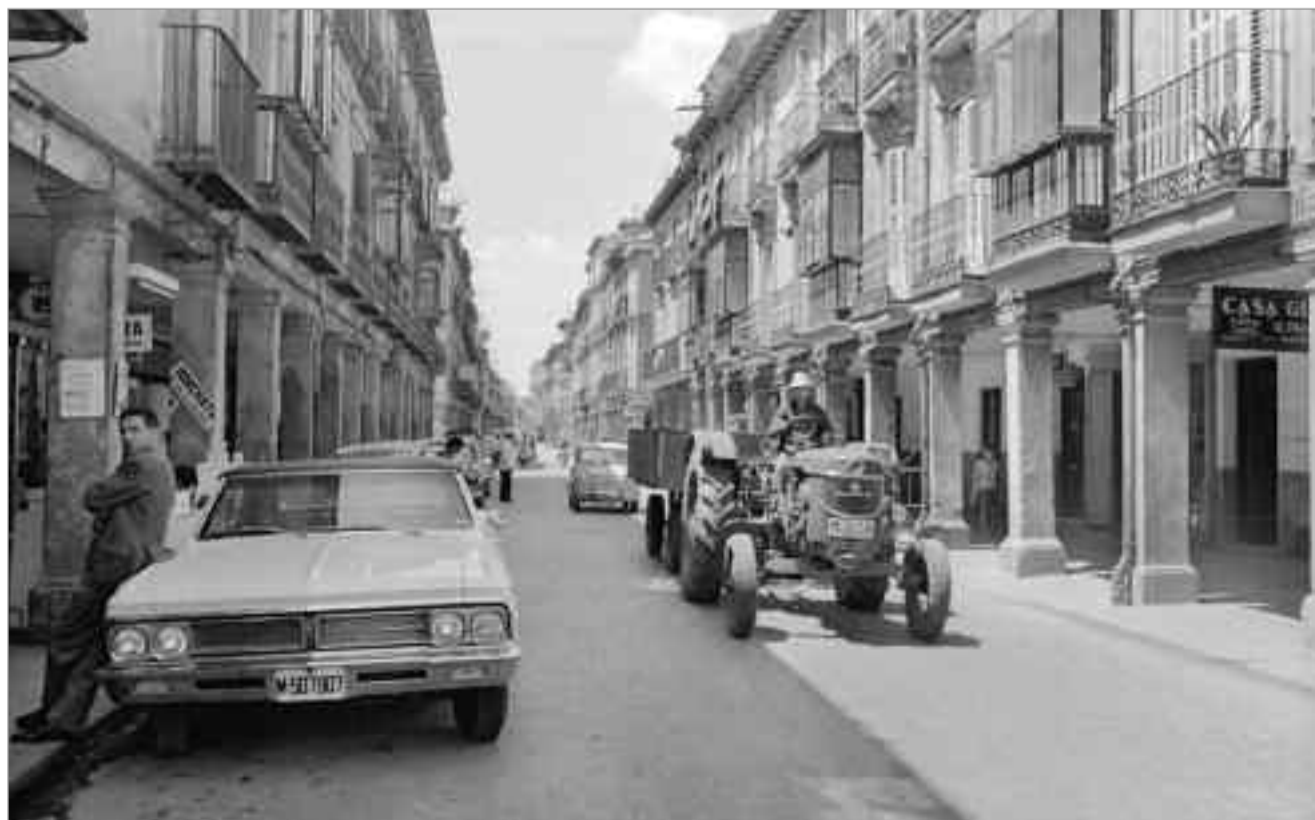
Santos Yubero. 1960-70. Alcalá de Henares. Calle Mayor. Archivo Regional de la Comunidad de Madrid. Fondo fotográfico Martín Santos Yubero.