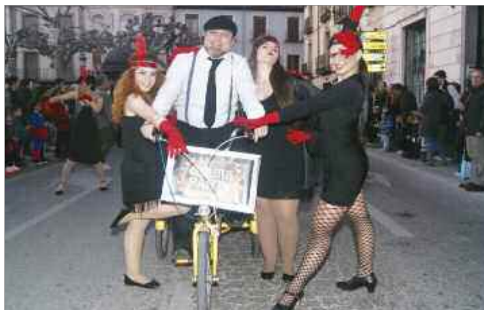
PRIMER PREMIO FRIKITRUMP