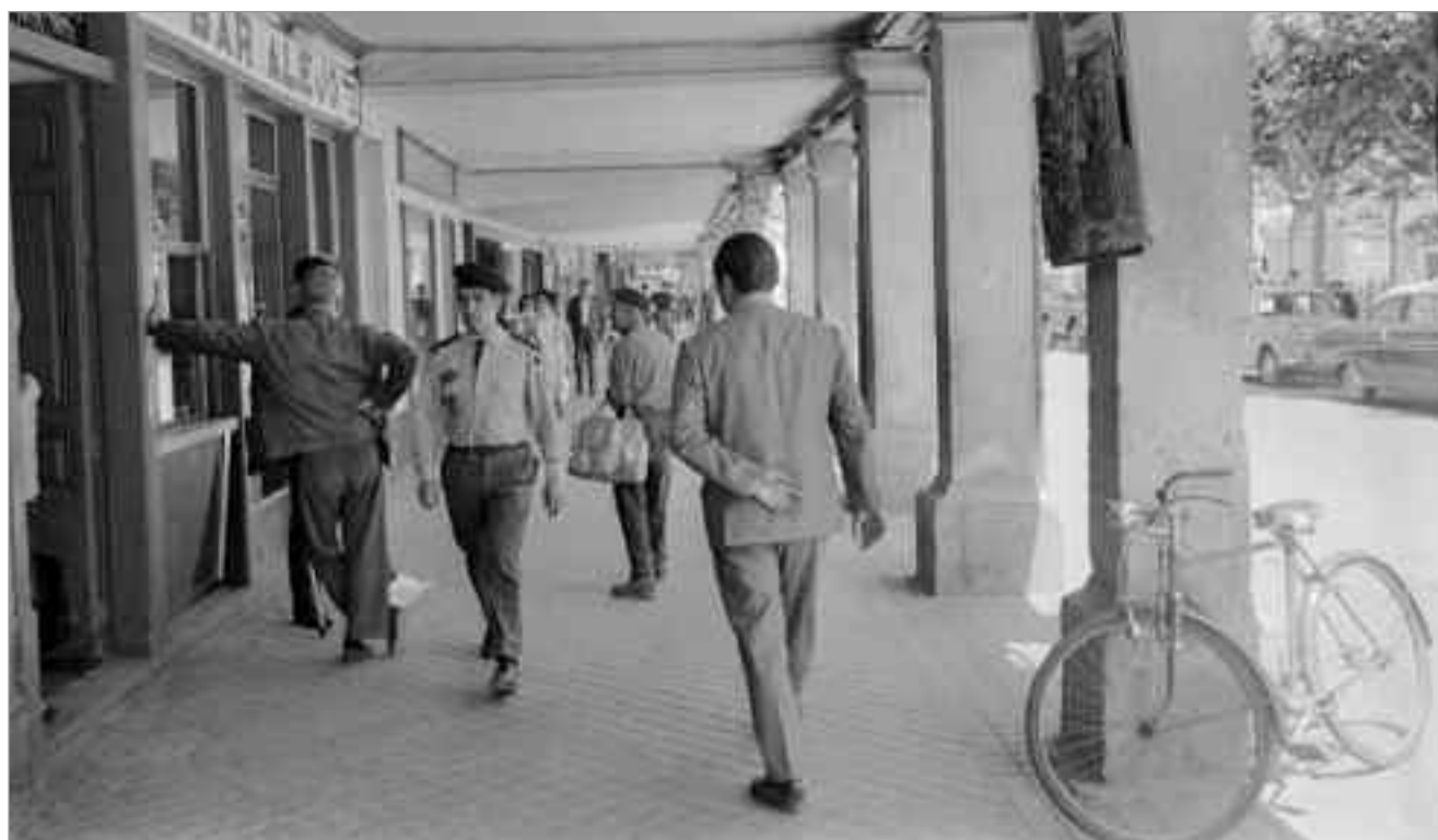
Santos Yubero. 1970-75. Alcalá de Henares. Soportales Plaza Cervantes. Archivo Regional de la Comunidad de Madrid. Fondo fotográfico Martín Santos Yubero.