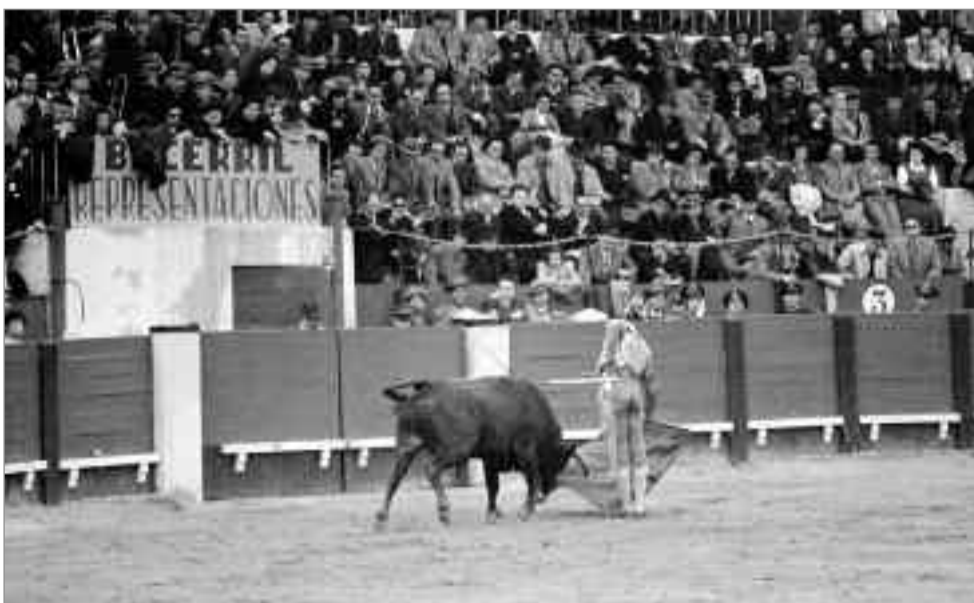
11 abril 1946. Alcalá de Henares. Reinauguración de la plaza de toros con los diestros Armillita, Antonio Bienvenida y Agustín Parra "Parrita".