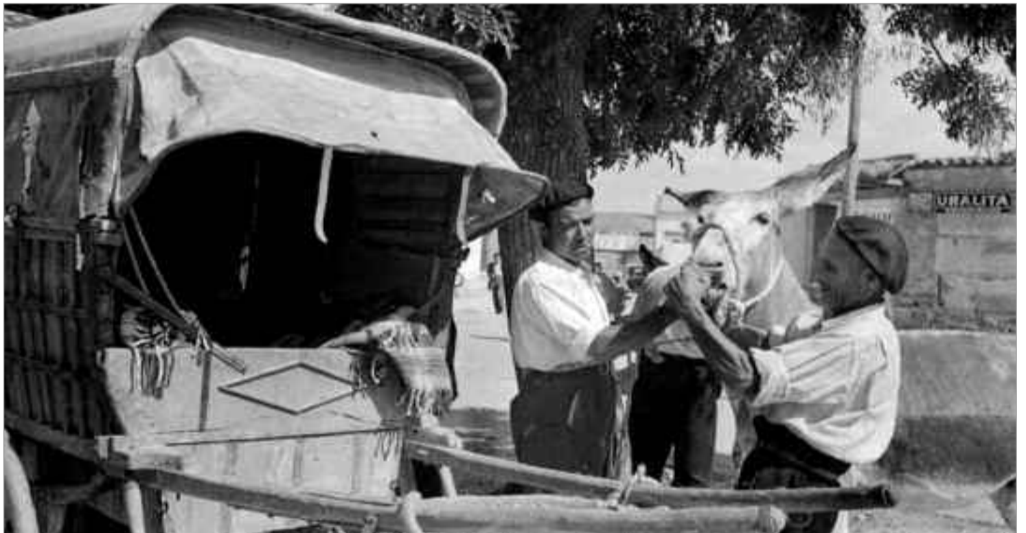
Agosto 1955. Alcalá de Henares. Feria. Mercado de ganado.