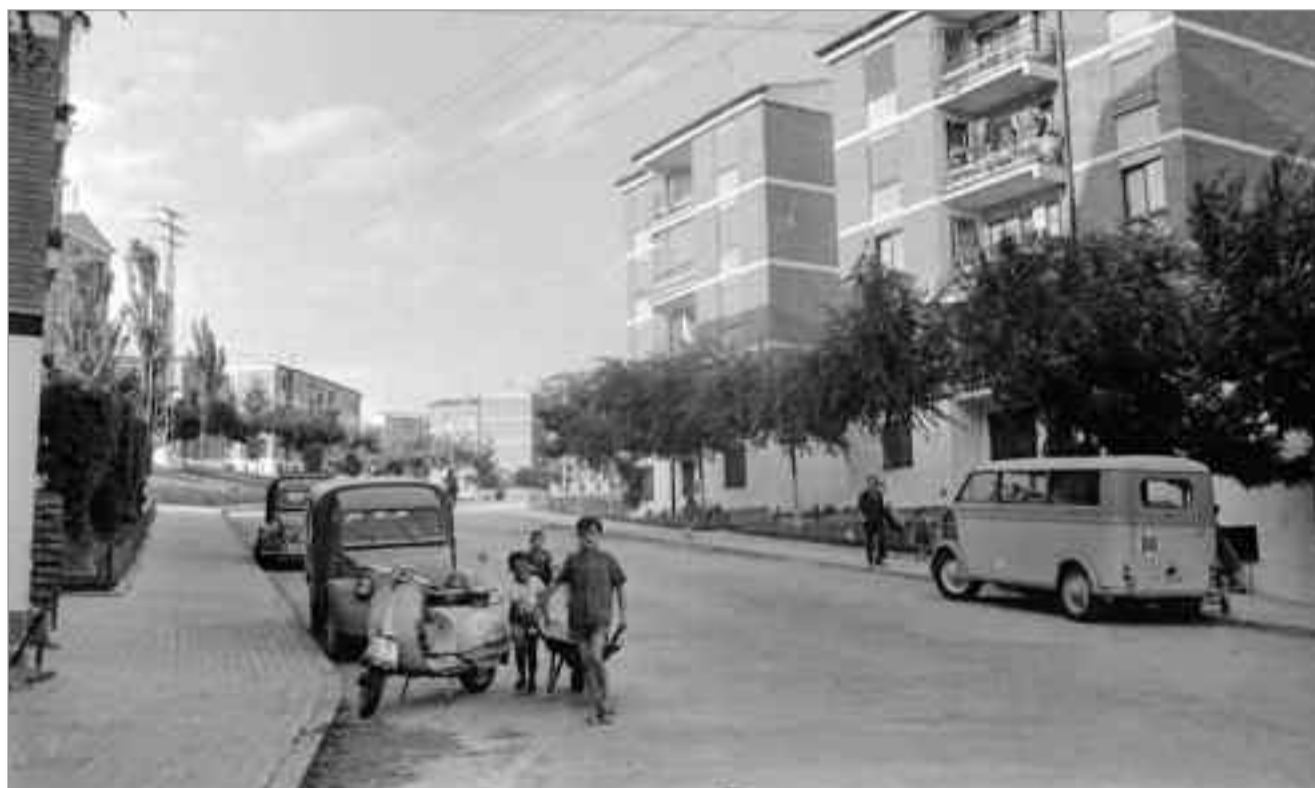
Santos Yubero. 1960-70. Alcalá de Henares. Campo del Ángel. Archivo Regional de la Comunidad de Madrid. Fondo fotográfico Martín Santos Yubero.