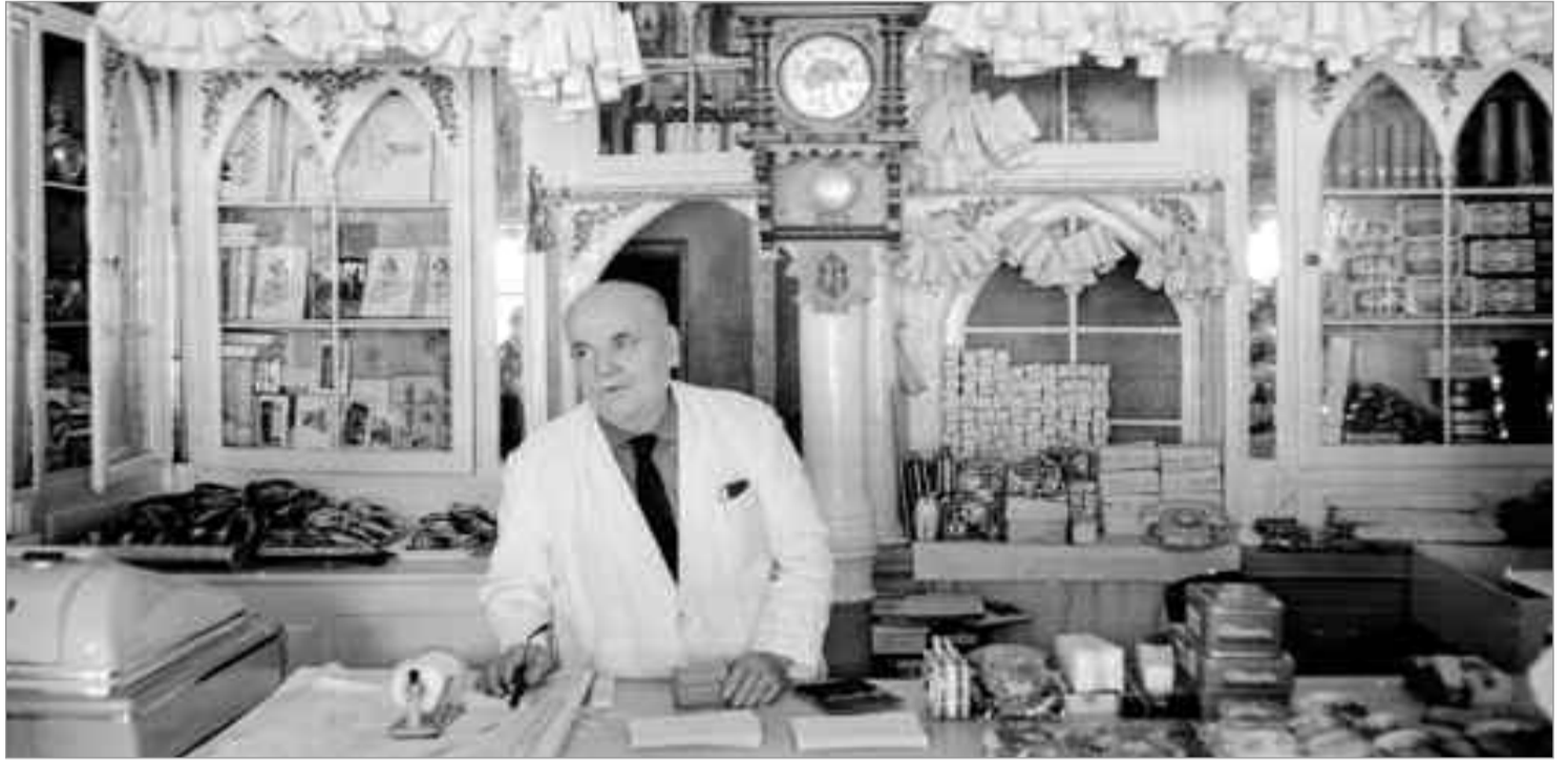
Santos Yubero. 1960-70. Alcalá de Henares. Confeitería Salinas. Archivo Regional de la Comunidad de Madrid. Fondo fotográfico Martín Santos Yubero. Sig.023404_053.