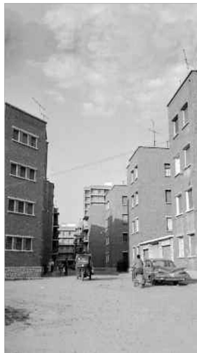
Santos Yubero. 1960-70. Alcalá de Henares. Calle Huertas. Archivo Regional de la Comunidad de Madrid. Fondo fotográfico Martín Santos Yubero. Sig.023404_011.